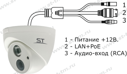
Рис.1 Схема подключения видеокамеры