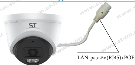
Рис.1 Схема подключения видекамеры